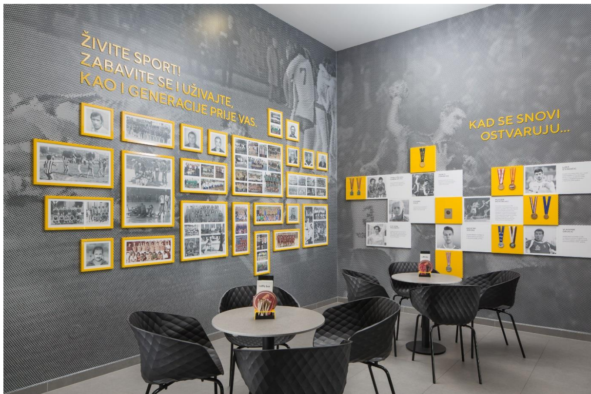
- Zid posvećen najvećim događajima u dvoranskim sportovima